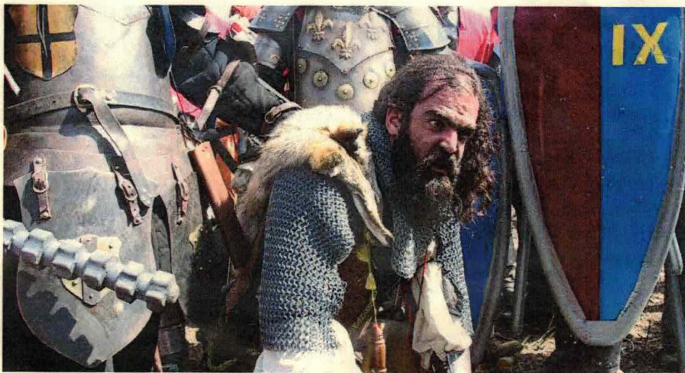
Exécution des chefs rebelles.

Chroniques historiques par le Duc Nicoppo de Solaris Novae