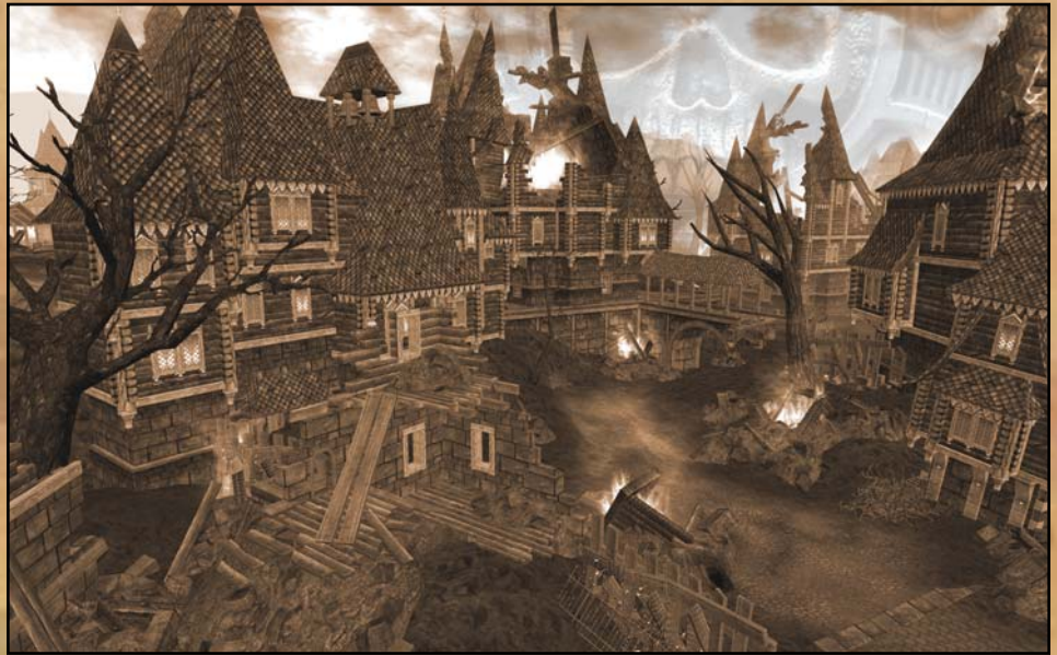
Fig. II - Un des nombreux quartier de la magnifique cité de Nuur, tel que croqué par le célèbre Einrich von Moneybags, Peintre-mercenaire connu pour ses oeuvres d'après-sinistre.

De récente enquêtes réalisé au moyen de sondage à l'aveugle effectué par le Haut Kommissariat Impérial aux Enquêtes Criminelles et à la Répression du Brigandage démontrent hors de tout doute patriotique que la secte des Archivistes serait coupable d'avoir dérobé les restes catatoniques du félon Walter Strauss exposés au Musée de la Kultur et de la Civilisation dans le cadre de l'exposition thématique Krimes et Châtiment . On se rappellera que Strauss avait mystérieusement sombré dans un coma neuro-végétatif peu de temps après avoir signifié son intention de se servir de la Constitution impériale à titre de papier hygiénique personnel... ☠