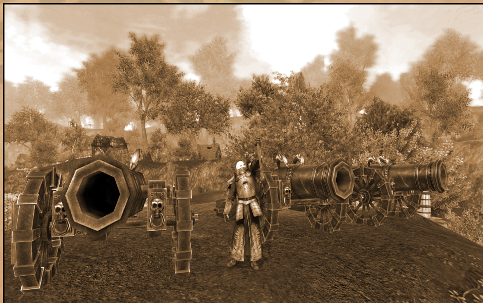
Fig. III - LE Reikskommissar Tarek le Taré devant le train d'artillerie de Mariembourg, prouvant une fois de plus hors de tout doute la véracité de la bonne vieille maxime "L'Empire vous tire!"

Pensée du jour - "Sers l'Empire aujourd'hui, car demain tu pourrais être mort."